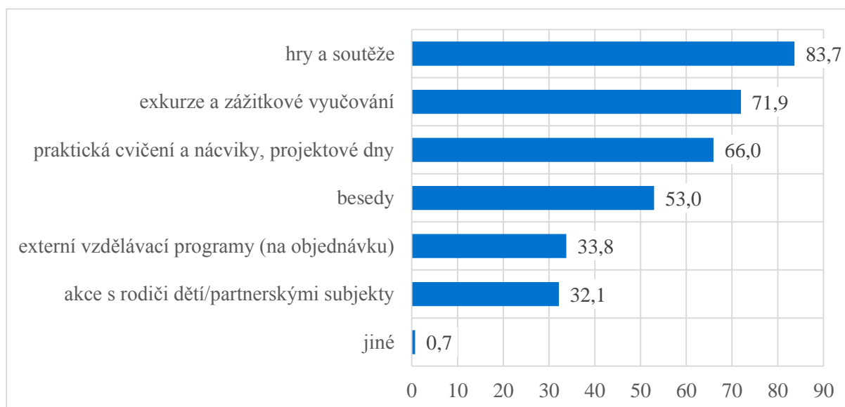
Graf č. 21 Využívané metody a formy ke vzdělávání dětí v oblastech DV, OČBRMU, OZ – podíl škol (v %)

K nejčastějším metodám a formám využívaným k výchově a vzdělávání dětí v oblastech bezpečnosti patří hry a soutěže (83,7 % škol), exkurze a zážitkové vyučování (71,9 % škol), praktická cvičení a nácviky a projektové dny (66 % škol) a besedy (53 % škol). Třetina mateřských škol využívá externí vzdělávací programy a pořádá akce s rodiči dětí/partnerskými subjekty.