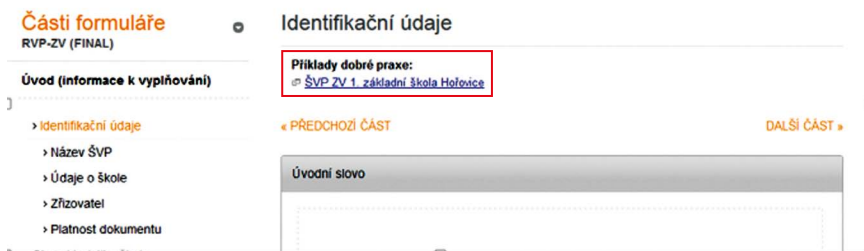
Obrázek 65 Příklad dobré praxe – ukázka

Na výše uvedeném obrázku je ukázka zobrazení odkazu na příkladně vyplněnou kapitolu formuláře (příklad dobré praxe). V tomto případě se jednalo o kapitolu ze ŠVP 1. základní školy Hořovice.