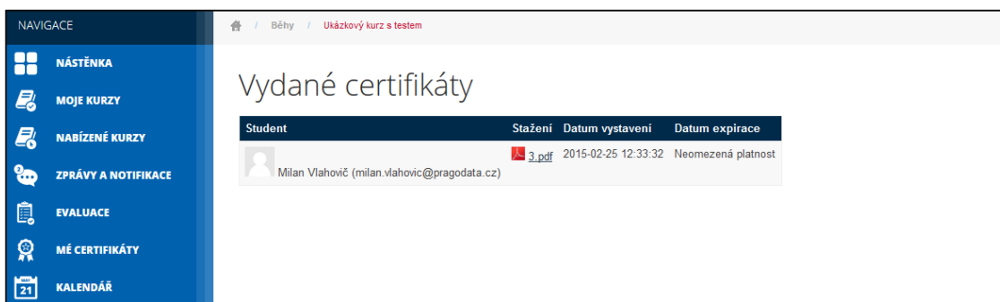
Obrázek č. 102: Zobrazení detailu certifikátu