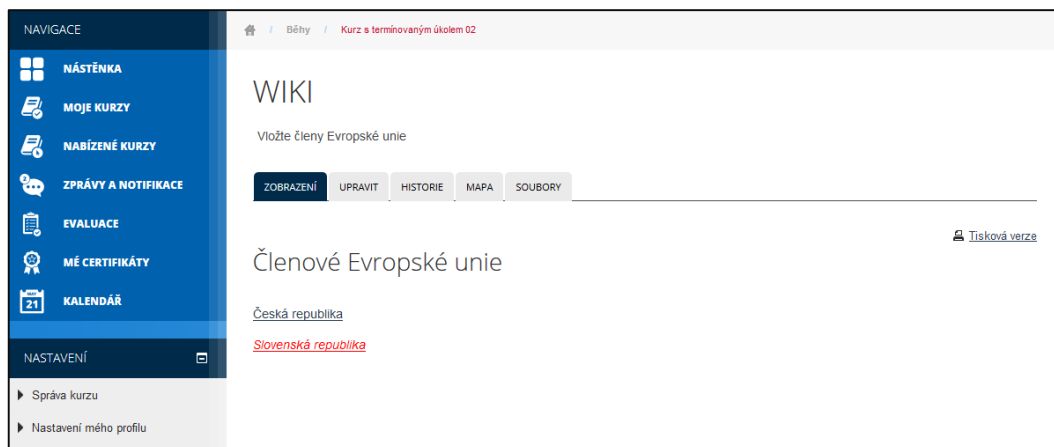
Obrázek č. 75: Zobrazení nového odkazu ve WIKI

Uložení odkazu je signalizováno jeho vložení na úvodní stránku WIKI.