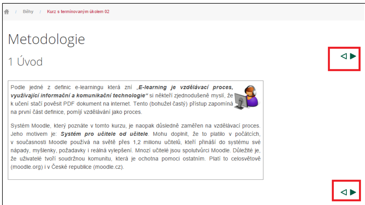
Obrázek č. 16: Příklad konkrétního studijního materiálu v kurzu

Jednotlivé typy studijních materiálů a činností jsou popsány v následujících kapitolách.