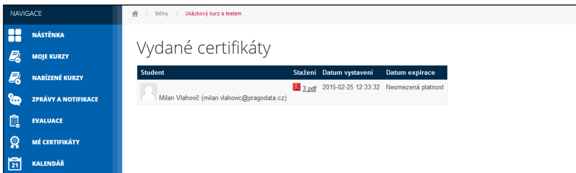
Obrázek č. 102: Zobrazení detailu certifikátu