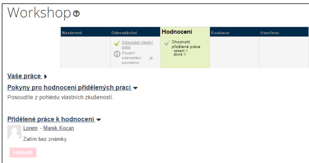
Obrázek č. 83: Workshop ve fázi hodnocení – před hodnocením

V závislosti na nastavení workshopu, může student odevzdanou práci upravit, a sice stiskem tlačítka Upravit odevzdanou práci a postupovat podle pokynů systému.