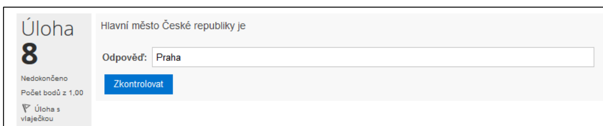
Obrázek č. 48: Krátká tvořená odpověď

Jedná se o přiřazovací úlohu, která je však vytvořena náhodně z úloh s krátkou tvořenou odpovědí. Odpověď student vybere z nabídky/roletky umístěné vpravo od zadání otázky. Možnost použít tento typ otázky předpokládá v testu existenci nejméně dvou krátkých tvořených otázek, proto je v tomto testu ještě jedna taková úloha popsána v kapitole 2.4.8.