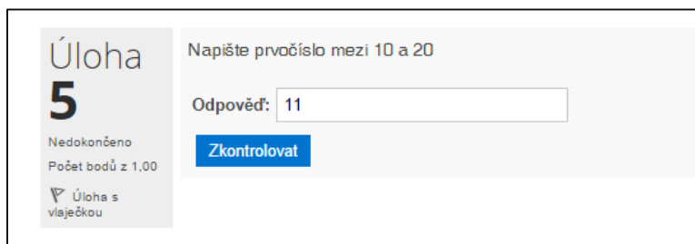
Obrázek č. 45: Numerická úloha

Odpověď je tvořena číselným údajem doplněným případně o jednotky. Odpověď je hodnocena na základě číselného srovnání s různými variantami odpovědi s danou tolerancí (absolutní nebo relativní).