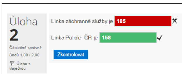
Obrázek č. 40: Okamžitá kontrola odpovědi

Správnost odpovědi může student kdykoliv ověřit stisknutím tlačítka Zkontrolovat . Tato funkce je dostupná pouze tehdy, pokud ji autor testu povolil.