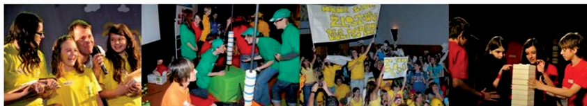
Obrázek 28 Ukázka vložení obrázku

Obrázky, videa, audia a multimédia vůbec jdou vkládat do popisku, složky, souboru a stránky. Můžete je také umísťovat do diskuze, ankety úkolu a testu.