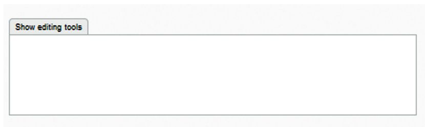
Obrázek 12 Pole pro instrukce

Při kliknutí na tlačítko Zobrazit editační nástroje se objeví nástroje k editování textu, nástroje pro vkládání obrázků, videí a nástroje pro odkazy na soubory či webové stránky.