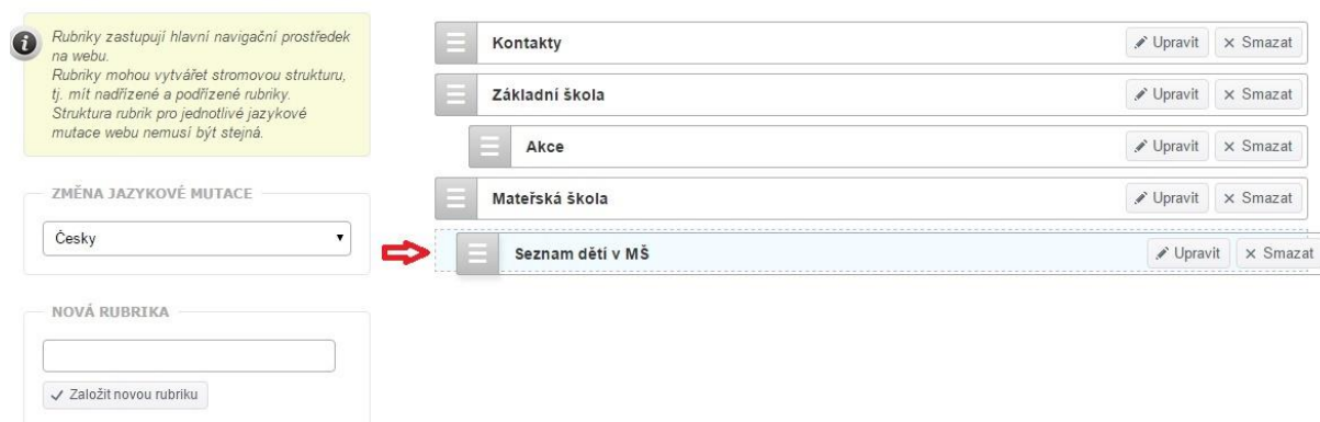
obr. 10 – Zařazení vytvořené podrubriky

Stejným způsobem vytvoříte i tzv. „podrubriku“, kterou pak tahem myši přetáhnete pod konkrétní rubriku, ke které má „podrubrika“ patřit.