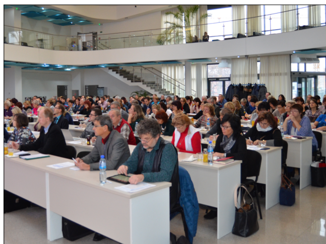
Ředitelky a ředitelé škol na semináři České školní inspekce v Olomouci dne 30. listopadu 2017.