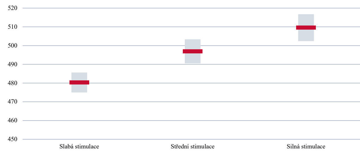
GRAF 5 | Průměrný výsledek (čtenářské dovednosti) dle míry vnímané stimulace zapojení žáků do výuky ze strany učitele

Jako potenciálně nejsilnější pozitivní faktor se jeví stimulace žáků k zapojení do výuky ze strany učitele. Metody stimulace žáků mohou souviset i s vnímáním zájmu ze strany učitele. Pokud žáci vnímají zájem učitele o výuku a jsou-li aktivně do výuky zapojováni, ptá-li se učitel na jejich názory apod., může to mít pozitivní vliv na jejich následný úspěch a na výsledky, kterých v oblasti čtenářských dovedností dosahují.