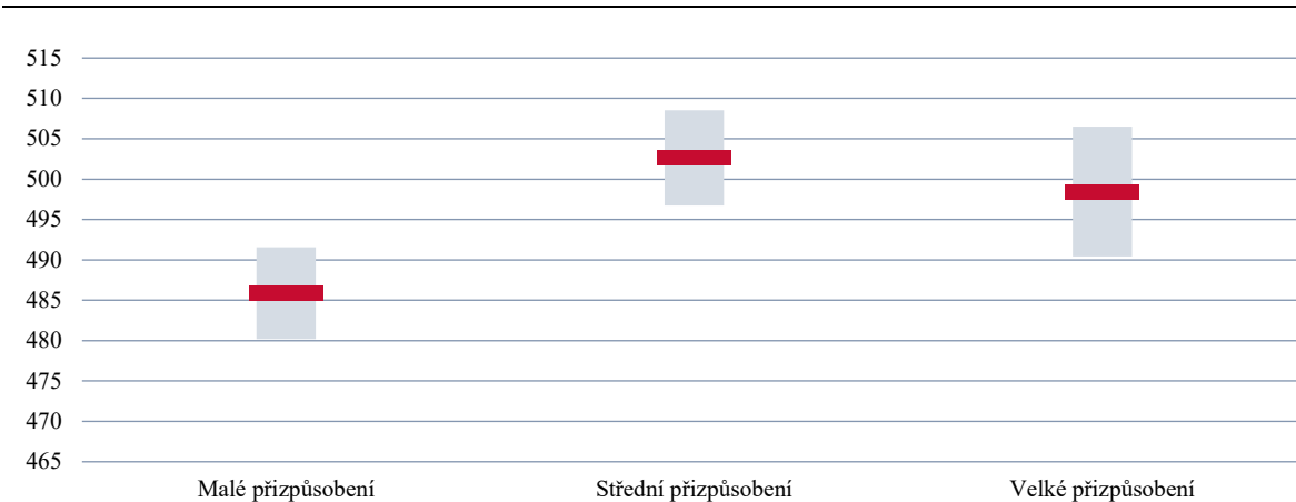
GRAF 4 | Průměrný výsledek (čtenářské dovednosti) dle vnímané míry adaptability výuky ze strany učitele

Vyšší hodnota indexu značí žáky vnímanou silnější adaptabilitu výuky ze strany učitele.