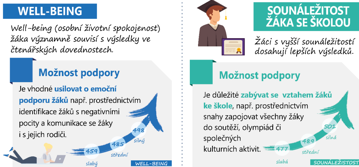
OBRÁZEK 2 | Vybrané faktory ovlivňující výsledky žáků podle PISA 2018*

* Pozn.: Statisticky významný rozdíl výsledku mají žáci ve skupině se „slabým well-being“. Rozdíl mezi žáky ve skupinách se „středním a silným well-being“ není statisticky významný. Statisticky významný rozdíl výsledku mají žáci ve skupině se „silnou sounáležitostí“. Rozdíl mezi žáky ve skupinách „střední a slabá sounáležitost“ není statisticky významný.