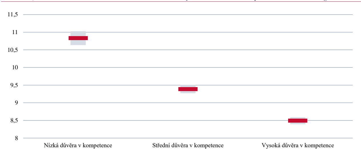
GRAF 42 | Průměr indexu stresu z chování žáků dle sebedůvěry učitele ve vlastní kompetence v třídním managementu

Podobně lze charakterizovat asociaci sebedůvěry učitele v uplatnění kompetencí třídního managementu a celkové spokojenosti učitele s pedagogickou profesí. Učitelé, kteří disponují vysokou důvěrou ve vlastní kompetence k třídnímu managementu, jsou zároveň ti, kteří udávají vyšší celkovou spokojenost s pedagogickou profesí, a naopak. Je důvodné očekávat, že stres učitele, jeho spokojenost, sebedůvěra v různých oblastech a řada dalších proměnných spolu působí ve složité matici asociací, kterou lépe vystihují modely ke konci kapitoly.