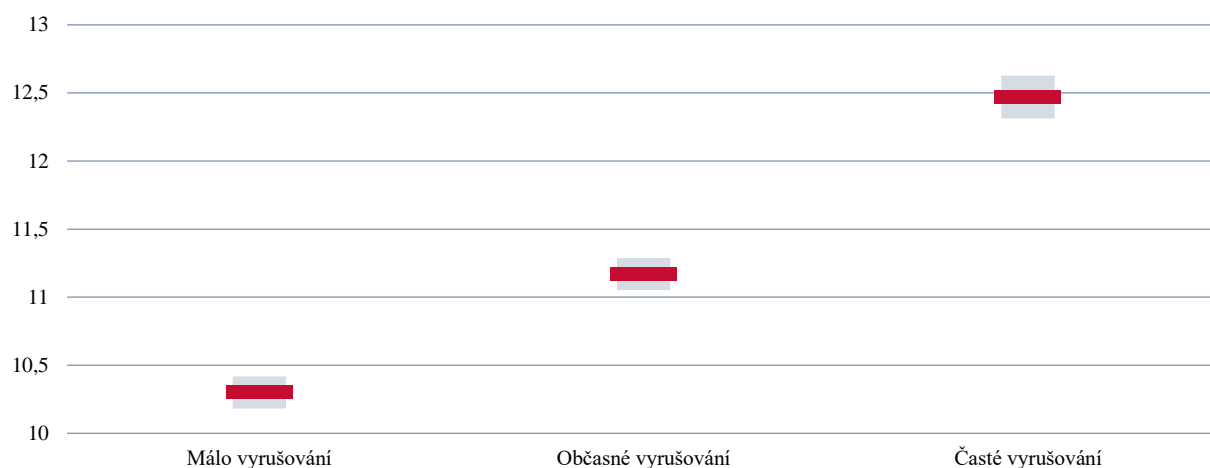
GRAF 38 | Průměr indexu využití třídního managementu dle míry vyrušování žáků v hodinách