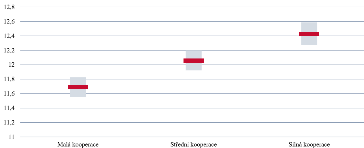
GRAF 7 | Průměr indexu celkové spokojenosti učitele dle míry udávané celkové spolupráce/kooperace mezi učiteli

Dle teoretických předpokladů nejen ve vztahu k žákům, ale právě i ve vztahu k učitelům, může mít vyšší míra koordinace vliv na některé další jevy. Často se uvádí např. významná role spokojenosti učitele se svou prací, která v komplexní realitě edukačních věd byla mnohokrát prokázána (i v rámci analýz České školní inspekce) jako významný faktor působící na výsledky žáků. V grafu 7 jsou prezentována data propojující spokojenost učitele s mírou udávané kooperace či koordinace. Spokojenost je měřena celkovým indexem spokojenosti učitele s prací a tříděna dle celkového indexu spolupráce mezi učiteli, děleného do tří kategorií pomocí metody Jenks Natural Breaks. Je patrné, že čím vyšší míra koordinace je učiteli udávána, tím se projevuje větší spokojenost učitele s prací. Rozdíly mezi jednotlivými kategoriemi jsou statisticky i věcně významné a předpokládaný vztah může být téměř lineární.