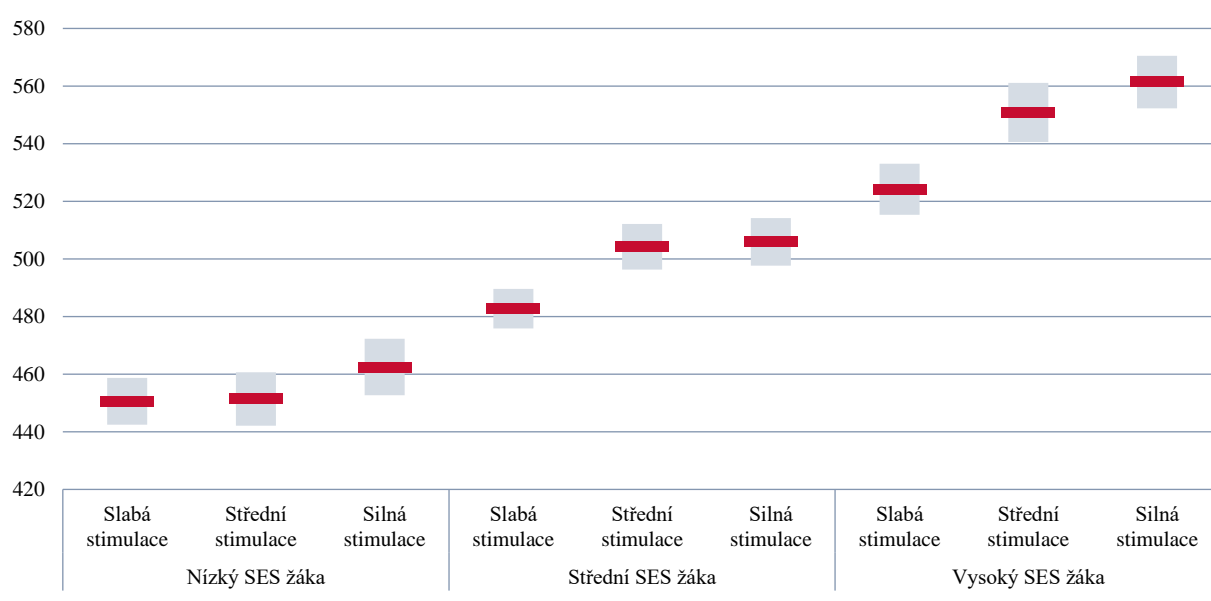
GRAF 53 | Průměrné skóre čtenářské gramotnosti dle míry vnímané stimulace zapojení žáků do výuky ze strany učitele a dle individuálního SES žáka

Poznámka: Červená linie značí průměrnou hodnotu, šedé pruhy 95% konfidenční interval.