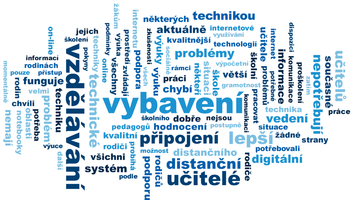
WORDCLOUD 1 | Co školám chybí pro lepší realizaci distanční výuky

Poznámka: Vytvořeno funkcí „wordcloud s aplikováním lemmatizace“ v programu MaxQDA.