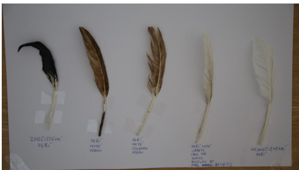
OBRÁZEK 4.6 | Srovnání různých metod čištění

Pokud skupiny zvolily odlišné způsoby čištění, mohou porovnat výsledky jednotlivých metod a vybrat tu nejvíce efektivní (viz obrázek 4.6).