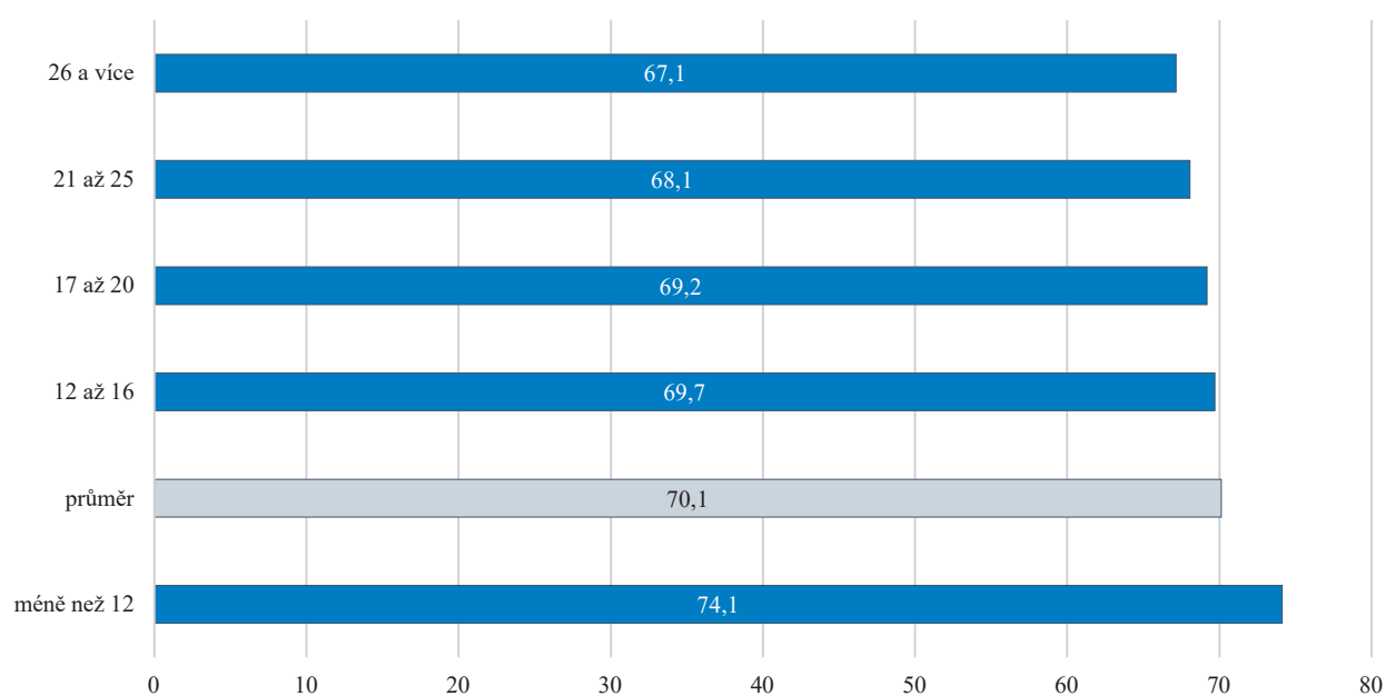
GRAF 39 | Četnost znaků kvalitní organizace výuky podle počtu přítomných žáků (v %)

V hospitacích jsou sledovány znaky kvalitní organizace výuky (zda je hodina dobře organizována, zda není jednotvárná vzhledem k činnostem žáků, zda jsou zapojeni všichni žáci, zda jsou aktivní a zda tempo hodiny odpovídá tempu žáků). Průměrná četnost kvalitativních znaků ve sledovaných hodinách patří mezi vyšší a činí 70 %. Mezi prvním a druhým stupněm je v četnosti těchto znaků nejvýraznější rozdíl 13 p. b. ve prospěch vyššího výskytu na prvním stupni. Na četnost znaků v hodinách má mírný vliv počet přítomných žáků ve třídě, což dokládá očekávaný význam využívání dělení ve výuce některých předmětů pro kvalitu organizace hodiny.