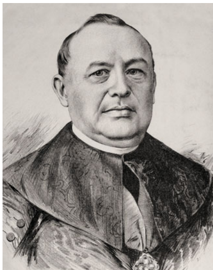
Obr. 29: Karel Vinařický, vlastenecký kněz, školdozorce a zakladatel české literatury pro děti

Karel Alois Vinařický, vlastenecký kněz, školdozorce, básník, spisovatel a překladatel, jedna z nejvýznamnějších osobností českého národního obrození a jeden z zakladatelů české literatury pro děti. Narodil se v rodině poněmčeného českého řemeslníka ve Slaném. Již během gymnaziálních studií se však zapojil do českého národního