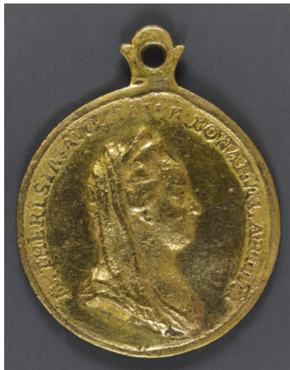
Obr. 14: Záslužná školní medaile pro premianty z roku 1776

Reformní úsilí neustalo ani za vlády Josefa II. Osvícenský panovník upravil záležitosti týkající se poddanství, nově uspořádal poměry státu a církve a v neposlední řadě změnil situaci ve státní správě, a tím i ve školství. Řada dalších nařízeních se týkala omezení moci katolické církve. Rušily se řády a kláštery. Byl vydán toleranční patent vyhlášující náboženskou svobodu. Nejen nekatolíci, ale i Židé přestali být omezováni a židovské děti se nyní mohly vzdělávat ve státních školách. Mezi povinné předměty patřilo i nadále katolické náboženství. Pro výchovu osvícensky založených kněží byly od roku 1783 pořádány semináře, ve kterých byli vyškoleni technici vy-