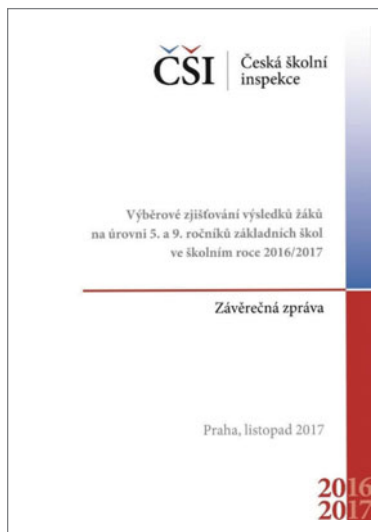
Obr. 66: Závěrečná zpráva ze zjišťování výsledků žáků na úrovni 5. a 9. ročníků ZŠ ve školním roce 2016/2017

je externí hodnocení realizováno, a řadu z těchto nástrojů pak zpřístupnila školám a školským zařízením k individuálnímu užívání v rámci autoevaluace, která je rovněž velmi důležitou složkou průběžného hodnocení vzdělávacího procesu. Další nástroje