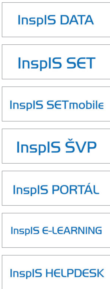
Obr. 65: Informační systémy ČŠI – loga

je externí hodnocení realizováno, a řadu z těchto nástrojů pak zpřístupnila školám a školským zařízením k individuálnímu užívání v rámci autoevaluace, která je rovněž velmi důležitou složkou průběžného hodnocení vzdělávacího procesu. Další nástroje