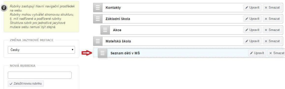
obr. 10 – Zařazení vytvořené podrubriky

Stejným způsobem vytvoříte i tzv. „podrubriku“, kterou pak tahem myši přetáhnete pod konkrétní rubriku, ke které má „podrubrika“ patřit.